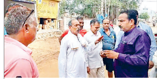
महेन्द्रगढ़। आपस में बातचीत करते समाज के लोग।