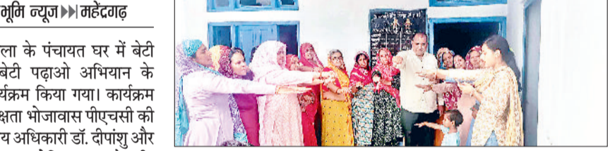
महेन्द्रगढ़। बेटी बचाने की शपथ लेते हुए।