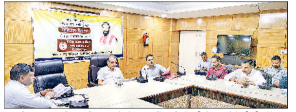
नारनौल। जल शक्ति अभियान को लेकर अधिकारियों की बैठक लेते डीसी डॉ. विवेक भारती।

महेन्द्रगढ़ जिले में जल संचयन और संरक्षण को बढ़ावा देने के लिए जल शक्ति अभियान 2025 कैच दरने व्हेन इट फॉल्स के तहत ठोस कदम उठाए जा रहे हैं। उपायुक्त डॉ. विवेक भारती ने मंगलवार को लघु सचिवालय में आयोजित बैठक में अधिकारियों को निर्देश दिए कि वे जल संचयन संरचनाओं को मजबूत करें और पारंपरिक जल निकासों व तालाबों का जीर्णोद्धार करें। डॉ. भारती ने सभी विभागों को निर्देश दिए कि वे इन दिनों को जेएसए पोर्टल पर नियमित रूप से