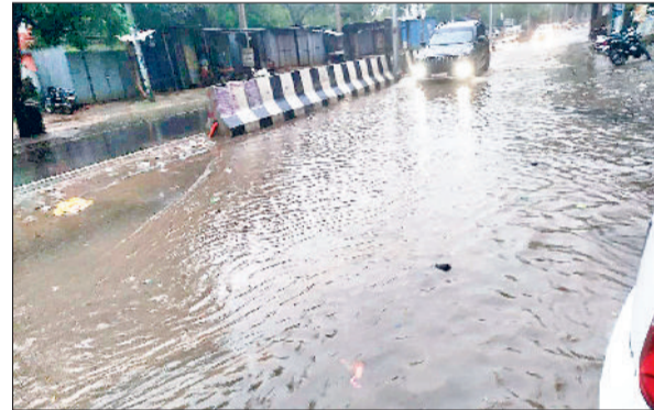
मंडी अटेली। अटेली-रेवाड़ी रोड पर स्वास्थ्य मंत्री कार्यालय के सामने भरा पानी।

लेकिन मंगलवार दोपहर बाद जिले में इस सीजन की अच्छी बारिश हुई है। पहले निजामपुर 26.0 मिलीमीटर, इसके बाद महेंद्रगढ़ में 31.0 मिलीमीटर, नारनौल में जबरदस्त 43.8 मिलीमीटर बारिश हुई है। वहीं अटेली में 39.0 मिलीमीटर, नांगल चौधरी 8.0, सतनाली में 5.0 मिलीमीटर बारिश हुई। जिले में नारनौल व महेंद्रगढ़ का दिन व रात का तापमान क्रमशः 30.2, 25.0 डिग्री सेल्सियस व 34., 25.4 डिग्री सेल्सियस दर्ज किया गया।