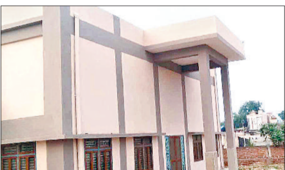
महेन्द्रगढ़। नगर पालिका द्वारा बनाया गया सामुदायिक भवन।

टेकेदार की पेमेंट रूकने से इन दिनों सामुदायिक भवन का काम रुका हुआ है। नगर पालिका की ओर से इस सामुदायिक भवन का निर्माण 2.62 करोड़ रुपये की लागत से हो रहा है। टेकेदार द्वारा अभी तक भवन का 95 प्रतिशत काम पूरा किया जा चुका है। वहीं नगर पालिका अध्यक्ष का कहना है कि टेकेदार की जल्द पेमेंट जारी कर काम पूरा करवाया जाएगा।