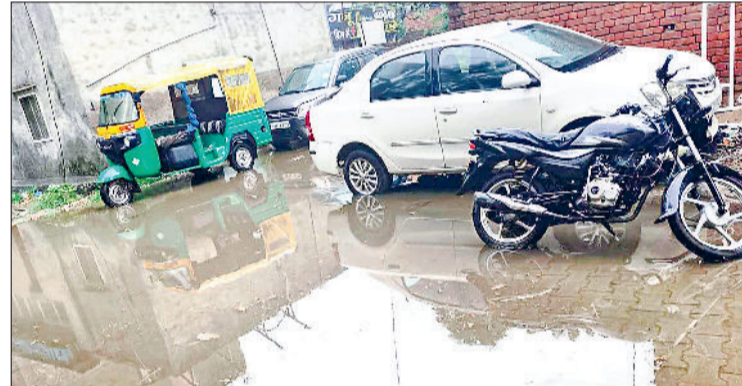
महेंद्रगढ़। डॉ. भगत वाली गली में भरा बरसात का पानी।

लोग घरों में कैद हो गए थे। दोपहर के समय शहर में चहल-पहल गायब हो गई थी। सड़कें सुनसान हो गई थी। गर्मी बढ़ने के साथ शीतल पेय पदार्थों की मांग बढ़ गई थी। बाजार में चौक-चौराहे पर नींबू पानी, गन्ना रस,