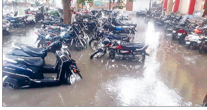
नारनौल। बस स्टैंड पार्किंग में जमा पानी व खड़े वाहन।