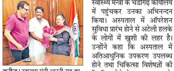
कनीना। स्वास्थ्य मंत्री आरती राव का आभार जताते भाजपा कार्यकर्ता।